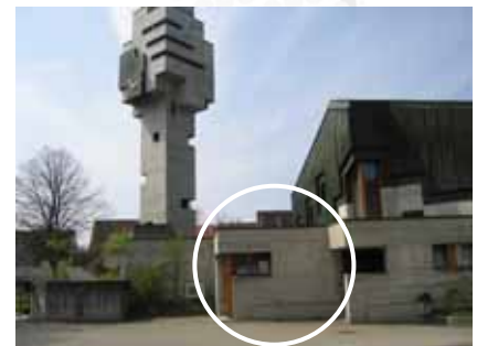
Der Standort des Aufbahrungsraums

Die Sanierungsarbeiten konnten zum Jahresende hin beendet werden. Ganz dem Zeitgeist folgend, steht den Angehörigen von Verstorbenen neu auch eine Aufbahrungsmöglichkeit für Urnen zur Verfügung. Die in die Jahre gekommenen Katafalken (Kühlapparaturen) wurden durch ein neues Model ersetzt. Aufgrund der starken Zunahme von Kremationen wurde darauf verzichtet, beide Katafalken zu ersetzen. Im Bedarfsfall kann auf die Infrastrukturen des Zentrum Passwang zurückgegriffen werden. Im laufenden Jahr wird abschließend das Fenster des Aufbahrungsraums ersetzt.